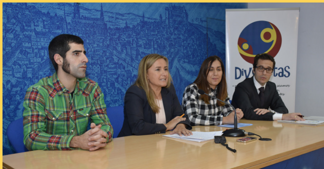
En la rueda de prensa estuvo presente uno de los componentes del grupo de rock 'Sidecars'