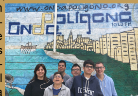
La temporada radiofónica de "El Altavoz" incluyó un especial en el Diversitas FEST

"El Altavoz", el magacín de radio inclusiva de CECAP que desde hace seis años emite en Onda Polígono de Toledo, ha llegado al final de su temporada 2017-2018. Un espacio donde una docena de participantes ejercitan su derecho de expresión y se encargan de preparar sus propias secciones, y que además sirve como canal de comunicación para dar cuenta de la actualidad de la entidad.